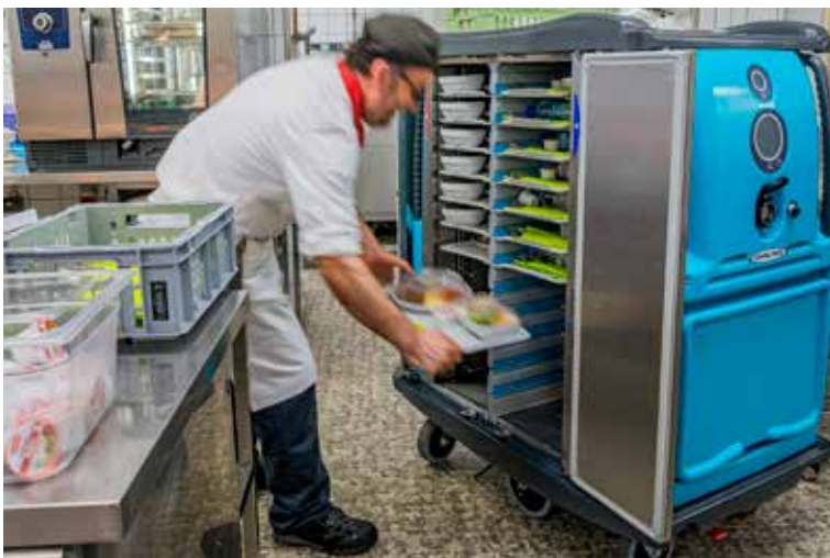
Nach dem Anrichten der Mahlzeiten werden die Tablettis in den vorbereiteten «Compactserv» der Steffen Gastro AG gestellt.

Die GastroPerspektiv AG steht für Coaching von Profiküchen für die Care- und Gemeinschaftsgastronomie wie auch für Restaurant- und Hotelküchen. So etwa im Pflegeheim oder Altersheim, im Spital, in der Tagesschule oder in der Kita. Die Coaches unterstützen dabei, Kosten zu sparen und gleichzeitig die möglichst hohe Qualität zu gewährleisten. Das Gesundheitszentrum Unterengadin begleitete die GastroPerspektiv AG von der Analyse bis zur Erfolgskontrolle.