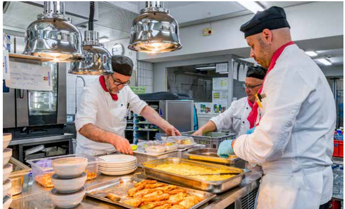
Die Küchenbrigade in der Zentralküche bereitet die Mahlzeiten für die Verteilung vor.