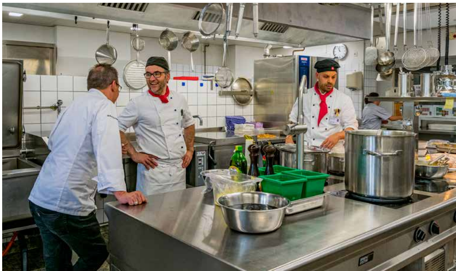
Die Küchenbrigade freut sich, wenn die von ihr zubereiteten Mahlzeiten auf den Transportwegen nichts an Qualität verlieren.